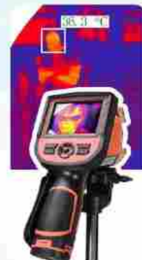
Detección de Temperatura

Te ofrecemos una alta gama de equipos desde sistemas a todo color, con audio bidireccional hasta sensor de movimiento, reconocimiento de rostro, humanos y placas o bien detección de temperatura.