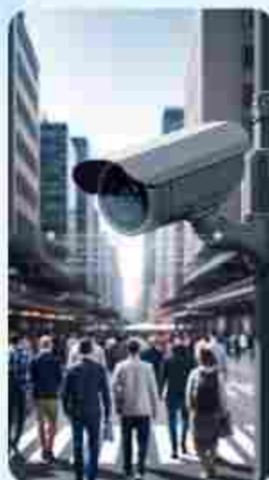
Reconocimiento Facial/ Placas